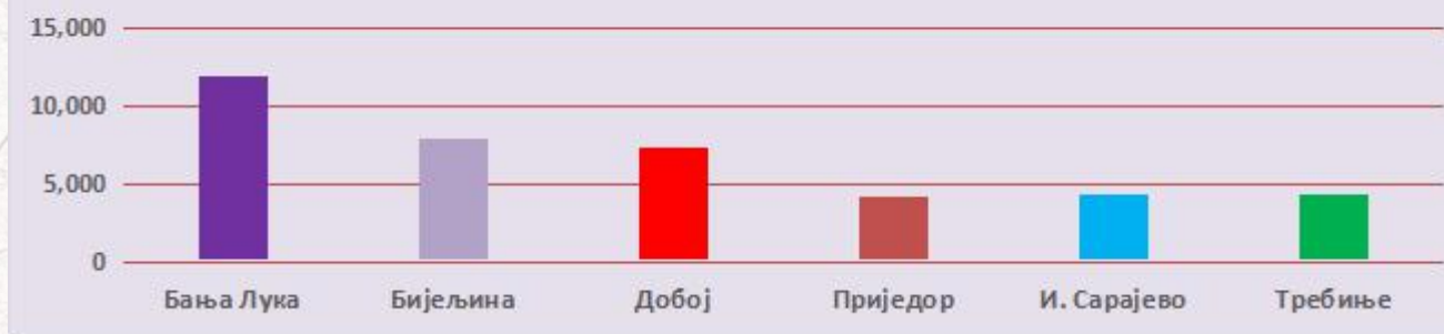
Графикон бр. 2 Преглед стања III степена стручне спреме