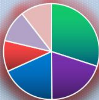
Графикон бр. 1 Стање на евиденцији

■ Бања Лука ■ Бијељина ■ Добој ■ Приједор ■ И. Сарајево ■ Требиње