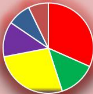
Графикон бр. 1 Стање на евиденцији

■ Бања Лука ■ Бијељина ■ Добој ■ Приједор ■ И. Сарајево ■ Требиње