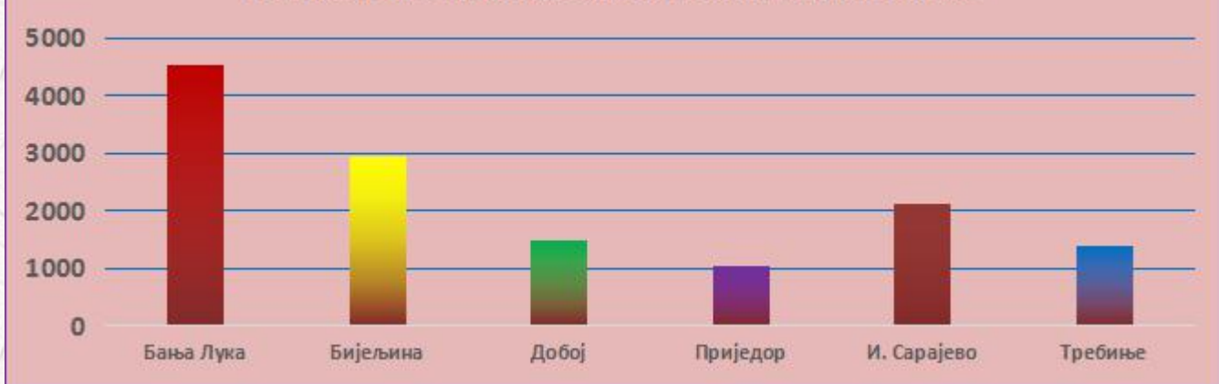
Графикон бр. 2 Преглед стања III степена стручне спреме