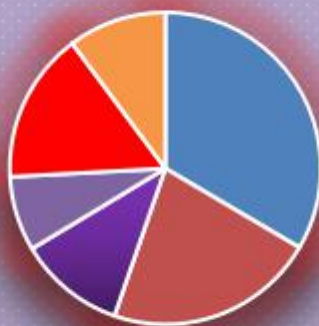
Графикон бр. 1 Стање на евиденцији

■ Бања Лука ■ Бијељина ■ Добој ■ Приједор ■ И. Сарајево ■ Требиње